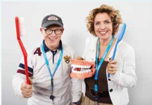
Prominente Unterstützung durch Schauspieler Bobby Brederlow und seine Kollegin Michaela May